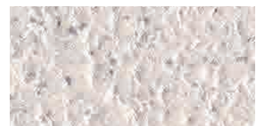
bocciardato / bush-hammered / gestockt