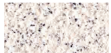
spazzolato / brushed / gebürstet