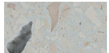
spazzolato / brushed / gebürstet