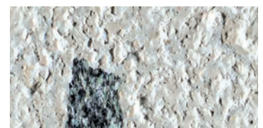
bocciardato / bush-hammered / gestockt