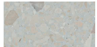
lucido / polished / poliert